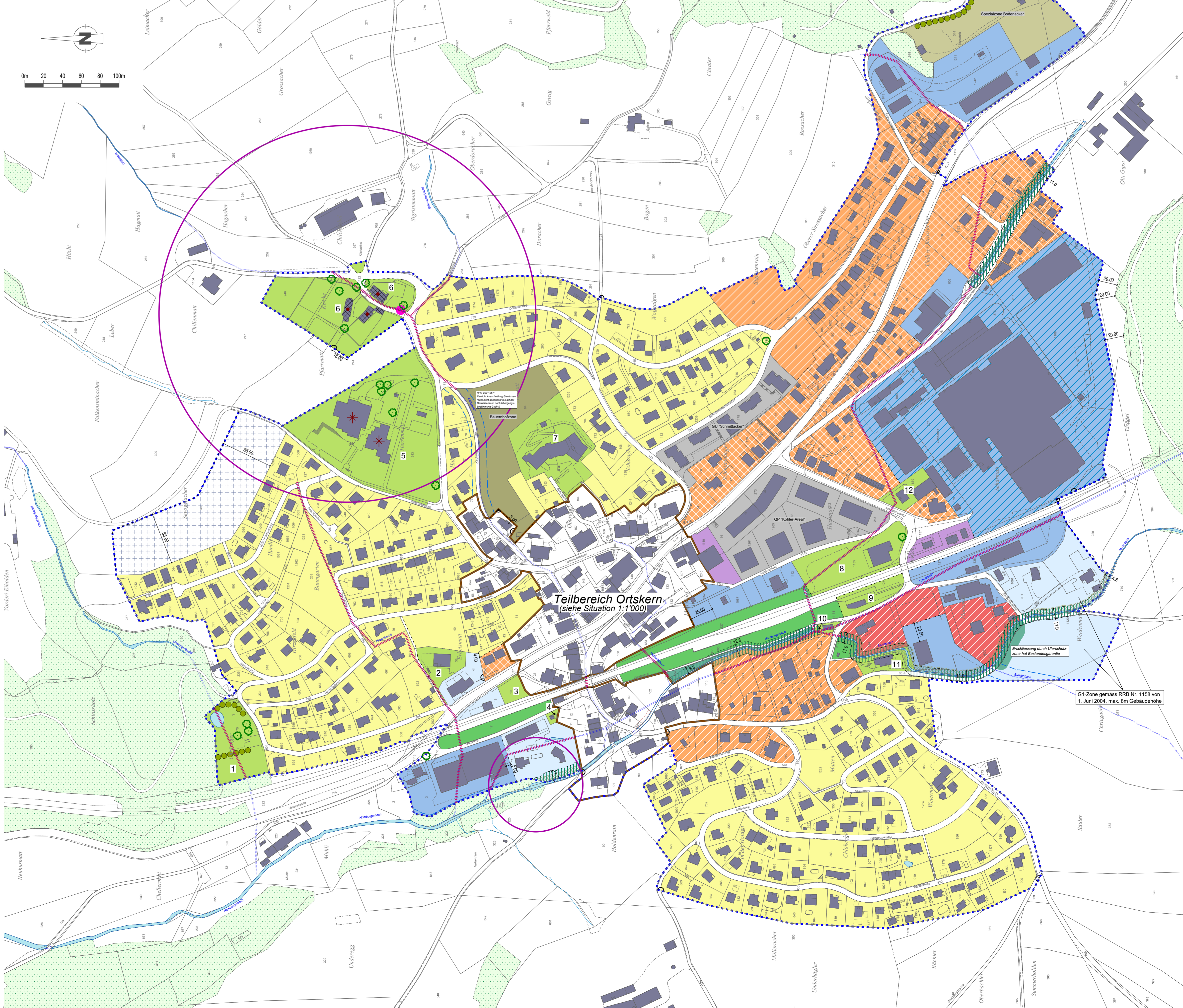
Teilbereich Ortskern (siehe Situation 1:1'000)